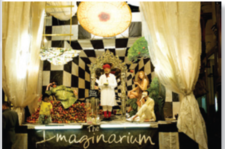
Кадр из картины «Воображариум доктора Парнаса»

ла Мюррея, ведь посмотреть на игру таких звезд интересно даже профессионалам, не говоря уже об обычной аудитории. В самой же картине тесно переплелись сказка и действительность – фильм представляет собой