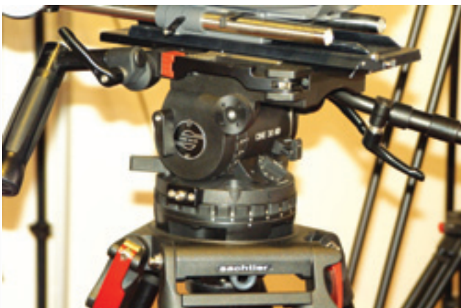
Панорамная головка Sachtler Cine 30 HD