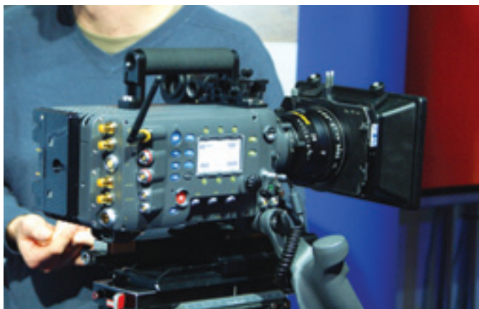
Макет новой камеры ARRI

В рамках экспозиции Panasonic можно было увидеть компактные видеокамеры формата P2HD, получающие все более широкое распространение в сфере документального кино, а также в области создания телесериалов и малобюджетных фильмов. Здесь же