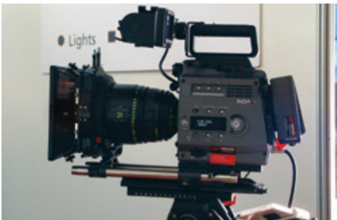
Цифровая кинокамера Sony F35