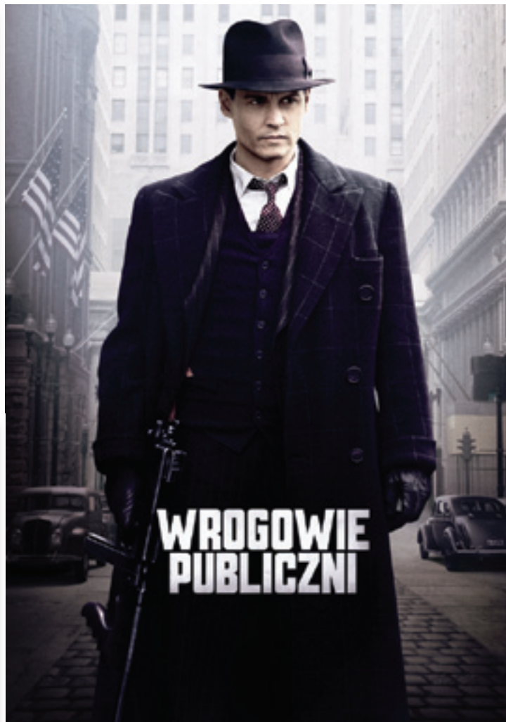
Афиша к фильму «Джонни Ди»

Чужеродным телом на фестивале выглядела российская лента «Кислород», о которой уже упоминалось выше. Но это не значит, что фильм – плохой. Он просто не соответствовал характеру фестиваля. Думается, среди артхаусных лент этот фильм выглядел бы более чем достойно. К тому же восприятие фильма зрителями осложнялось тем, что львиная доля его смысла заложена не в изобразительном ряде, а в тексте, которого не просто много, а очень много, ведь речь фактически идет об экранизации альбома одной из российских музыкальных групп. Так что и переводчики-синхронисты изрядно помучились, не говоря уже об иностранной аудитории, добросовестно пытавшейся вникнуть в сюжет. Думается, вряд ли это многим удалось.