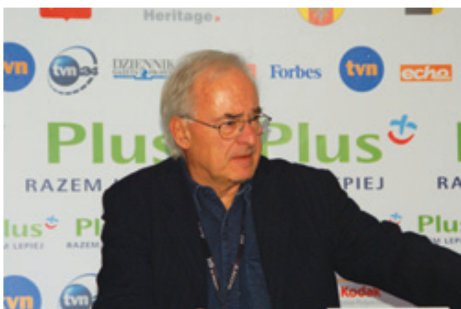
Данте Спинотти проводит пресс-конференцию