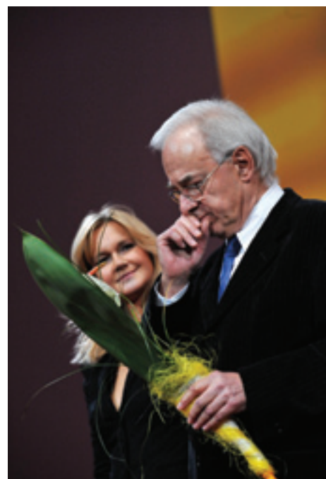
Лауреат Lifetime Achievement Award Данте Спинотти