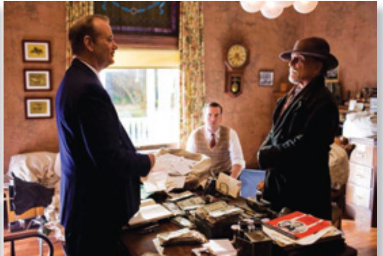
Кадр из фильма «Двигайся ниже»