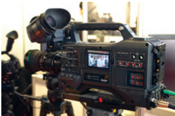
Видеокамера Panasonic формата P2HD