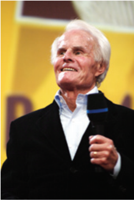
Ричард Занук