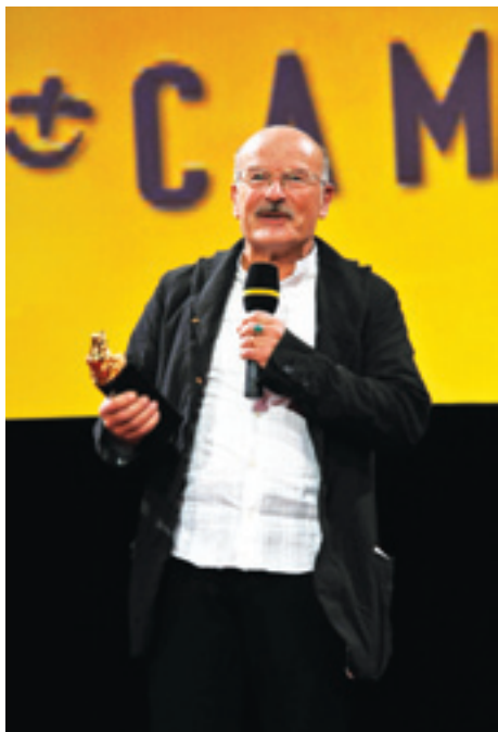
Волкер Шлендорф

вожера», «Выстрел из милосердия», «Утраченная честь Катарины Блюм», «Девятый день» и т.д.